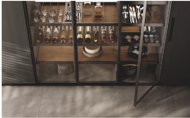
Portes en verre fumé transparent et cadre aluminium finition gris Anthracite sur système paroi "Fluida"; équipement intérieur avec accessoires Classy Frame et crédence lumineuse Solaris Back.