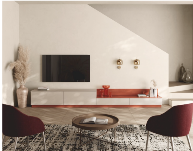
Cette composition présente des portes en mélaminé Chanvre et des plans en stratifié gris Mouette et laque coloris Brique, tous deux en épaisseur 1,2 cm. Socle, H 8 cm en laque brillante coloris Brique.

Affichant un design de caractère, la solution d'ameublement Moda « introduit une beauté intemporelle qui s'intègre parfaitement dans les habitats modernes, souligne Scavolini. Défini par son élégance, sa polyvalence et ses solutions personnalisables, le projet interprète l'habitat avec des finitions exclusives et un style capable d'associer harmonie visuelle et praticité. »