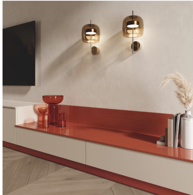
Cette composition présente des portes en mélaminé Chanvre et des plans en stratifié gris Mouette et laque coloris Brique, tous deux en épaisseur 1,2 cm. Socle, H 8 cm en laque brillante coloris Brique.

Sont également disponibles des portes en verre avec cadre dans différents styles : finitions acier foncé, champagne et anthracite, à associer avec les verres fumé, bronze et "Screen".