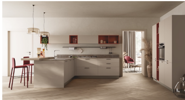
Cette composition en "L" présente des portes en mélaminé Jute associées à des éléments ouverts en laque mate coloris Brique. Le plan de cuisine est en grès cérame Native Red (épaisseur 2 cm). À noter également le plan-snack Melting en stratifié Polo Club (épaisseur 6 cm).

On remarque notamment les poignées agrémentant le modèle, qui ne sont pas de simples éléments fonctionnels mais deviennent de véritables traits distinctifs conférant du caractère à chaque composition ; disponibles dans de nombreuses variantes – saillante, intégrée dans la porte ou encastrée – et dans un choix riche de propositions satinées, peintes ou anodisées, « elles s'adaptent avec raffinement à toutes les exigences », à en croire le fabricant transalpin.