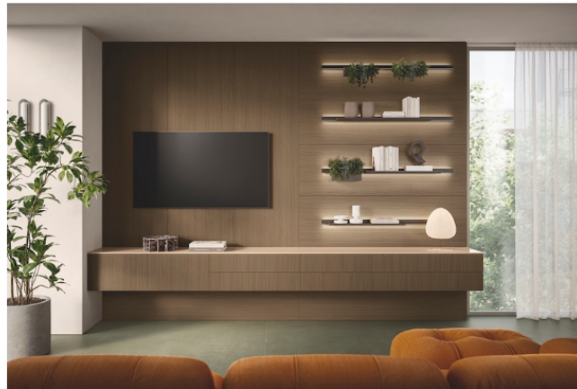
Portes du meuble suspendu et des panneaux en mélaminé Chêne Toffee. Plan laqué brillant coloris Gingembre (épaisseur 1,2 cm). Barre porte-accessoires Rail et étagères en aluminium.

Conçu pour devenir le point central d'un "Open Space" mais convenant également aux volumes plus restreints, Essenza se distingue par un design qui interprète le minimalisme avec chaleur et personnalité. « En allant bien au-delà des archétypes du blanc et du noir, il s'ouvre ainsi à une palette de finitions, textures et nuances capable de refléter tous les styles de vie, de l'élégance la plus sobre aux suggestions vintage », souligne la marque.