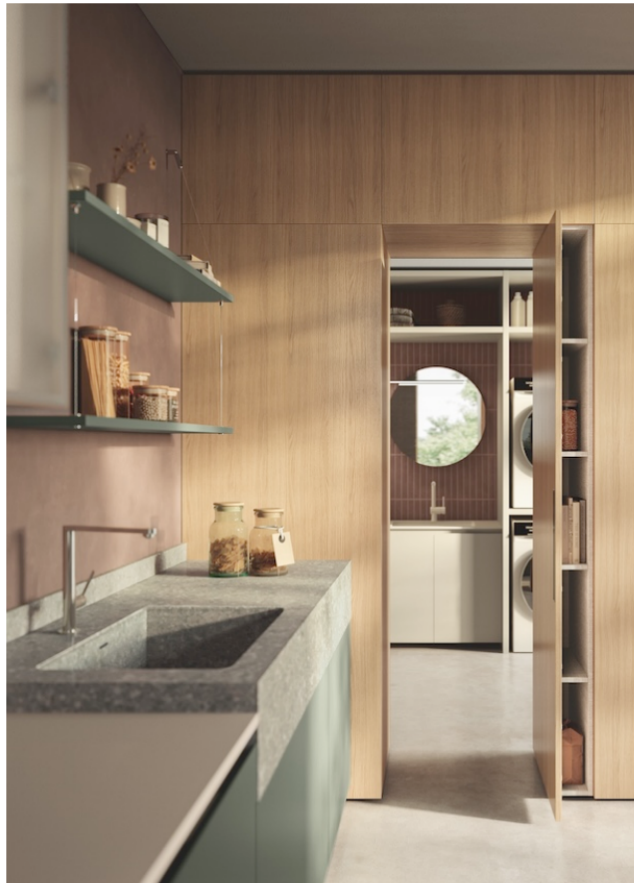
Solution Freepass avec portes en mélaminé Chêne Gold, qui relie la cuisine et la zone Laundry Space.

Essenza ne se limite pas à la cuisine et s'étend naturellement au salon, en intégrant de nouveaux accessoires Cross Elements qui étoffent la liberté de composition et accentuent la continuité des espaces : des solutions Solaris Back et Air Box aux boiseries Vertical System, et des meubles pleine hauteur Maxidoor au système modulaire Freepass, qui crée des passages intelligents entre les pièces ; sans oublier les modules Sail avec porte en saillie, qui apportent du rythme et du dynamisme aux compositions.