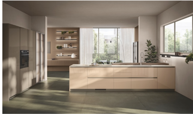
Portes en laque brillante coloris Gingembre et plan cuisine en Dekton Zephir (épaisseur 1,2 cm). Plan petit-déjeuner plaqué Frêne Pécane (épaisseur 6 cm). À gauche, système de colonnes avec portes en laque brillante coloris gris Matera, associé au système paroi Fluida avec portes en verre et cadre aluminium.

Essenza... Ce nom évocateur reflète bien l'âme du modèle éponyme que dévoile Scavolini en cette fin d'année 2025, et qui se destine à aménager la cuisine et le salon : Cette solution d'ameublement transversal de l'habitat se veut en effet « la synthèse du style contemporain, une rencontre entre matériaux, technologie et façonnages soignés qui crée des espaces distinctifs et accueillants », précise le fabricant transalpin.