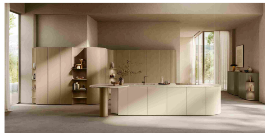
Flair di Scavolini in laccato opaco Panna Porcellana, completa di isola con top in Vitium Technology con texture Super Beige

Un linguaggio progettuale morbido e sofisticato identifica il nuovo modello Flair di Scavolini, che viene presentato ad Eurocucina nello stand dell'azienda (Pad. 02 - Stand B03-B09). In Flair, le linee fluide, le superfici materiche e le proporzioni equilibrate si fondono in un complesso compositivo avvolgente, in cui l'estetica diventa anche esperienza percettiva. Un approccio che risponde al desiderio crescente di spazi più "umani", progettati per favorire comfort, armonia visiva e benessere quotidiano. Il design del nuovo modello di privilegia quindi la fluidità delle forme attraverso terminali arrotondati, volumi delicati e dettagli curvi che, eliminando spigoli e i volumi rigidi, definisce in modo preciso l'identità del progetto migliorandone l'ergonomia complessiva. Una scelta particolarmente efficace negli open space contemporanei, dove cucina e zona giorno si fondono in un unico paesaggio domestico e la transizione tra le funzioni richiede soluzioni sempre più integrate.