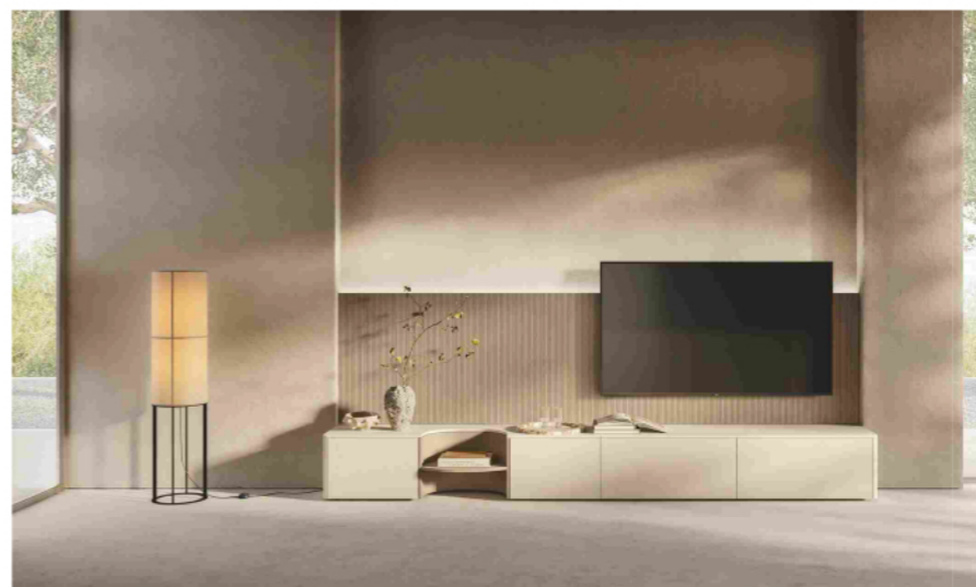
Scavolini, il living di Flair con mobile finito da terminali arrotondati e vano a giorno concavo impiallacciato

Le superfici e i profili curvilinei di Flair sono interpretati da Scavolini attraverso una selezione di materiali, finiture e colori, pensata per valorizzare al massimo la componente sensoriale e visiva del progetto offrendo innumerevoli possibilità di personalizzazione. La gamma va dai laccati opachi e lucidi, ideali per eleganti giochi di luce dal carattere contemporaneo, agli impiallacciati in essenze naturali, capaci di aggiungere calore e autenticità agli spazi. Completano la proposta piani top innovativi, che uniscono prestazioni tecniche elevate a una raffinata resa estetica. Le superfici diventano così parte integrante del design, amplificando la morbidezza delle forme e contribuendo a creare un'atmosfera sofisticata. Inoltre, grazie all'elevata componibilità, il progetto si adatta a configurazioni lineari, ad isola o a penisola, mantenendo sempre un forte impatto architettonico e un'identità definita e riconoscibile.