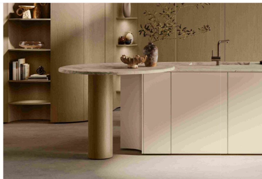
Flair Kitchen di Scavolini, il dettaglio del terminale concavo dell'isola in sintonia con il sostegno del tavolo

Le superfici e i profili curvilinei di Flair sono interpretati da Scavolini attraverso una selezione di materiali, finiture e colori, pensata per valorizzare al massimo la componente sensoriale e visiva del progetto offrendo innumerevoli possibilità di personalizzazione. La gamma va dai laccati opachi e lucidi, ideali per eleganti giochi di luce dal carattere contemporaneo, agli impiallacciati in essenze naturali, capaci di aggiungere calore e autenticità agli spazi. Completano la proposta piani top innovativi, che uniscono prestazioni tecniche elevate a una raffinata resa estetica. Le superfici diventano così parte integrante del design, amplificando la morbidezza delle forme e contribuendo a creare un'atmosfera sofisticata. Inoltre, grazie all'elevata componibilità, il progetto si adatta a configurazioni lineari, ad isola o a penisola, mantenendo sempre un forte impatto architettonico e un'identità definita e riconoscibile.