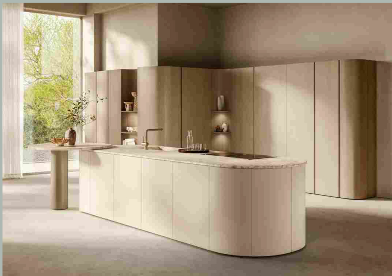
Scavolini, le forme morbide di Flair

Home > Prodotto > Cucine & Design > Eurocucina | Scavolini, le linee fluide di Flair