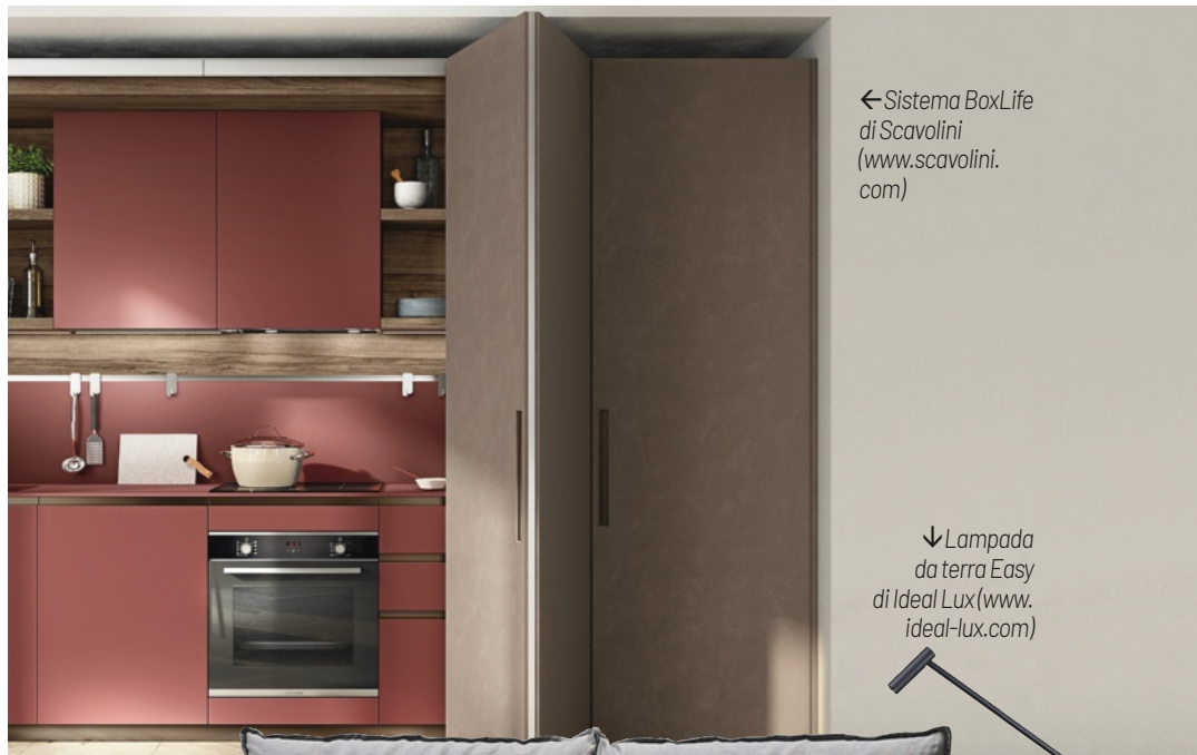
← Sistema BoxLife di Scavolini ( www.scavolini.com )