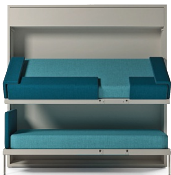
Sistema di letti a castello a scomparsa Kali Duo di Clei ( www.clei.it )

Per spazi ridotti o polifunzionali esistono sistemi componibili con letti a ribalta (una volta chiusi hanno una profondità ridotta e sembrano degli armadi ). All'interno contengono le reti, comprensive di materassi , che si aprono tramite meccanismi di trasformazione, e utilizzano molle a gas con dispositivi ammortizzati, incassati nella struttura, a garanzia di movimenti fluidi e silenziosi, con sistemi di sicurezza che evitano aperture accidentali .