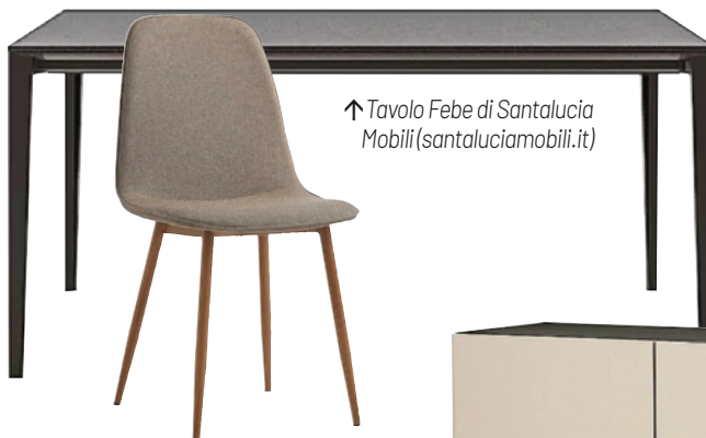
↑ Tavolo Febe di Santalucia Mobili ( santaluciamobili.it )