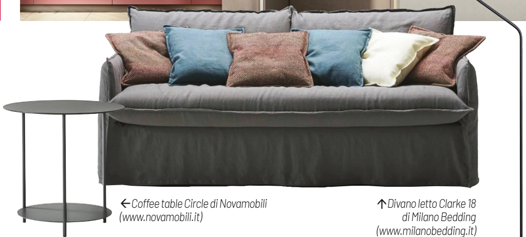
← Coffee table Circle di Novamobili ( www.novamobili.it )