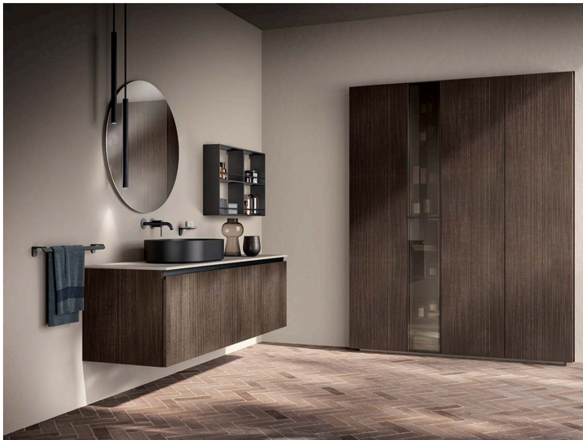
Miko by Scavolini, design Vuesse

Look moderno, appeal trasversale, dettagli di stile. Con questa formula Scavolini ha dato vita al nuovo programma di arredo bagno. Miko è la nuova proposta rivolta ad ambienti che ricercano un design minimale ma al contempo attento ai particolari. Ancora una volta l'azienda si è concentrata su un segno grafico per dare carattere al progetto: è infatti la distintiva anta squadrata con profilo a "L" l'elemento che caratterizza il sistema. Una peculiarità che diventa allo stesso tempo decoro geometrico capace di infondere leggerezza e linearità a ogni composizione. La ricerca stilistica si estende poi alla duplice proposta di gola, Flat o Round , che connota anche il copri fianco.