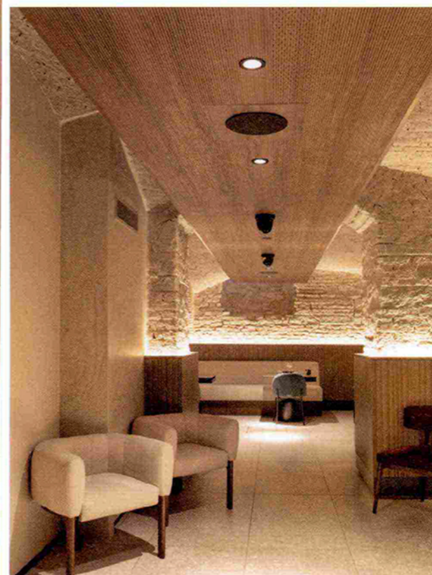
DOMÒ, MILANO Il ristorante di cucina giapponese con interni di Naos Design si trova nell'ex museo dei Navigli, in via San Marco, zona Brera. Il comfort acustico delle sale è assicurato dal sistema 4akustik di Fantoni . Installato a soffitto senza intaccare la struttura, è realizzato in Mdf con fresature che garantiscono il corretto grado di fonoassorbimento. • The Japanese restaurant with interiors by Naos Design is located in the former Navigli museum, in via San Marco, Brera area. Pleasant acoustics in the rooms are guaranteed by the 4akustik system by Fantoni. This is installed on the ceiling (without damaging the structure) and is made of MDF with milling that guarantees the correct level of sound absorption. fantoni.it