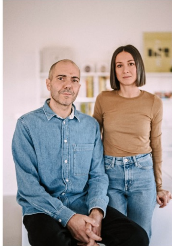
Spalvieri & Del Ciotto