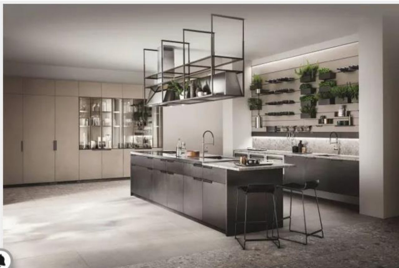
Isola della cucina Mia by Carlo Cracco di Scavolini

Per le prese degli elettrodomestici sarà utile prevedere delle barre a led sul bancone per illuminare efficacemente il top.