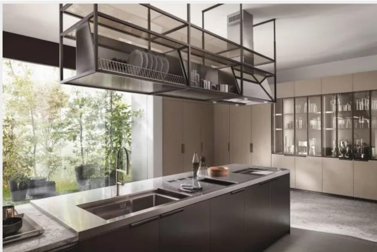
Cucina Mia by Carlo Cracco di Scavolini

Tutta la zona operativa è ospitata sull'isola, che offre anche un'ampia superficie di lavoro e un piccolo piano snack. Il bancone è coronato da cappa e pensile con vani portaoggetti. L'isola della cucina Mia by Carlo Cracco di Scavolini in acciaio scuro, ha il top in acciaio inox (H 5 cm) e piano snack in gres Ceppo di Grè (H 3 cm). Di fianco, gli armadi per contenere piccoli elettrodomestici hanno ante a libro con telaio in alluminio, finitura acciaio scuro e vetri stopsol chiaro. Prezzo da rivenditore. http://www.scavolini.com