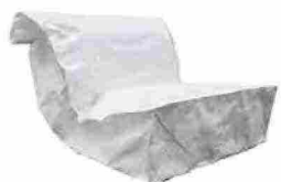
2011 Poltrona Sacchetto in Tyvek® [prototipo].