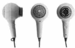
2009 Asciugacapelli Kenny [Trabo].

“Facciamo pochi progetti ogni anno e lavoriamo in prima persona a ognuno di questi. La lentezza permette di sbagliare e correggere, quindi di migliorare.”