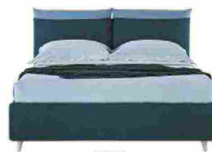
2021 Letto Milord [Perdormire].