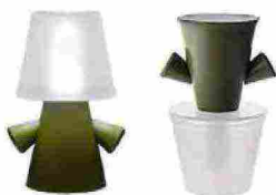
2010 Lampada Greenman [Lexon].