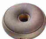
2014 Speaker Hoop [Lexon].