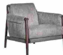
2020 Poltrona Times Lounge [Poltrona Frau].

Ritaglio stampa ad uso esclusivo del destinatario, non riproducibile.