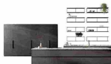
2024 Cucina Stilo [Scavolini].