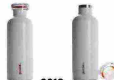
2019 Borraccia Energy [Fratelli Guzzini].