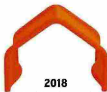
2018 Seduta The Roof Chair [Magis].