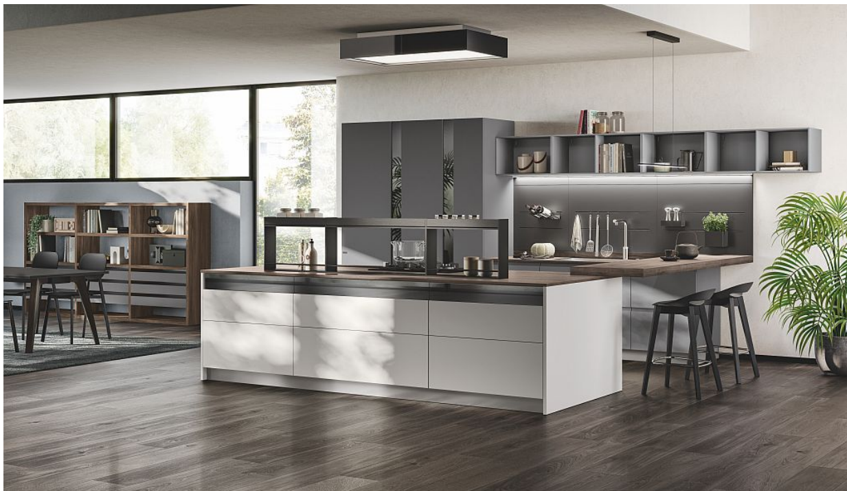
Scavolini: Motus in laccato opaco Grigio Airone e laccato opaco Grigio Vulcano