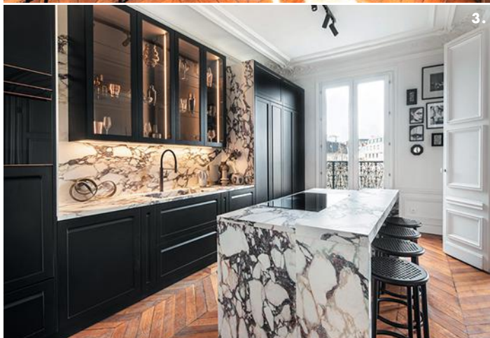
1. Légèreté des volumes pour «Libra», qui agrandit sa gamme de laqués, brillants et mats, et propose aussi, à combiner, une version à listels verticaux. Îlot de repas en stratifié Fenix. 2. Synergie entre mode et design avec «Diesel Get Together», collection d'inspiration industrielle qui imagine également des éléments indépendants, idéaux pour les espaces urbains, comme le «Misfit Cart» en métal peint, exposé, en jaune, dans l'Appartement parisien. 3. Proportions classiques pour «Carattere», design Vuesse, portes laquées mates et îlot en céramique effet marbre.