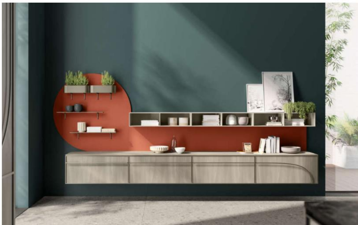
Jeometrica di Scavolini: lo schienale "a goccia", disponibile anche rettangolare e rotondo

Il risultato dell'imponente lavoro di ricerca su stile, materiali e funzioni ha condotto così ad un progetto cucina fortemente connotato a partire dal disegno delle maniglie in tubolare di metallo , elemento distintivo di Jeometrica soprattutto nella versione curva , che tratteggia in modo sinuoso la superficie dell'anta. Speciale anche il design dell' anta a telaio con profili in alluminio disponibili bianchi, antracite o titanio . Nella soluzione presentata, i frontali in decorativo Betulla si abbinano al telaio e maniglie tubolari in alluminio finitura Titanio; speciale lo schienale attrezzato "a goccia" in laminato Rosso Tegola . Ma Nichetto, per Jeometrica, è andato oltre il progetto della cucina disegnando anche sedie, sgabelli, tavoli, e di lampade in vetro per arredare con continuità anche la zona pranzo .