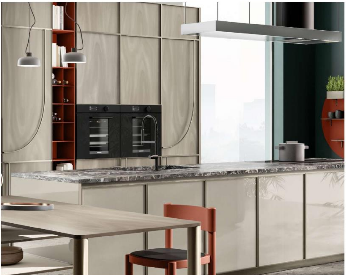
Le ante a telaio e la maniglia curva caratterizzano Jeometrica di Scavolini

Jeometrica , di Scavolini , è la prima cucina in assoluto disegnata da Luca Nichetto nella sua brillante carriera. Per il concept del nuovo sistema - che arreda sia la cucina sia la zona pranzo - Nichetto ha tratto ispirazione dalle opere di Giò Ponti , maestro dell'architettura, e dai segni grafici e dai colori decisi delle creazioni artistiche di Ellsworth Kelly e Donald Judd reinterpretandone le morfologie. Nella video intervista, Luca Nichetto parla di Jeometrica spiegando chiaramente tali concetti. "Questa è la mia prima cucina", afferma il progettista, "e l'idea nasce dalla mia esperienza personale data dalla frequentazione assidua di questo spazio" , dice il designer, che come tanti, durante la pandemia, ha scoperto il piacere di cucinare e di stare insieme. "Un'esperienza - continua Nichetto - che mi ha portato a riflettere sull'arte del cucinare, ma anche sull'idea di portare l'arte nella cucina guardando ai lavori di artisti come Ellsworth Kelly e Donald Judd, che hanno lavorato sul concetto di modularità" .