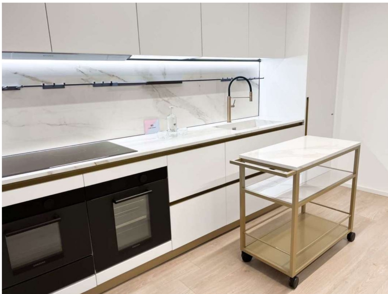
Scavolini: la cucina creata per l'headquarter di Chiara Ferragni Brand

Home › News › Aziende › Scavolini per l'headquarter di Chiara Ferragni Brand