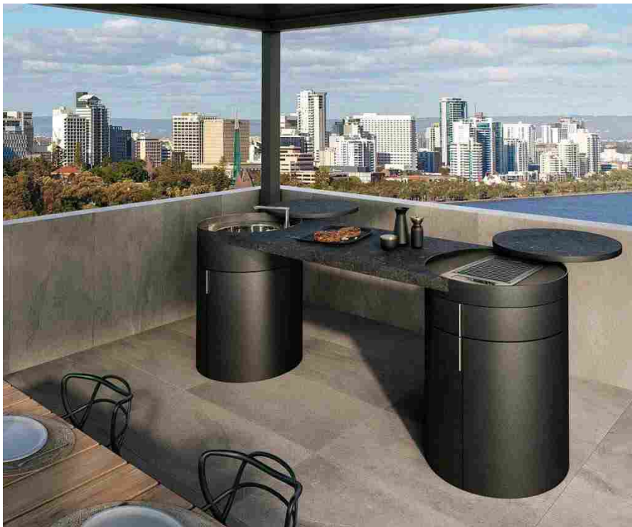
Xera: la cucina outdoor Stem