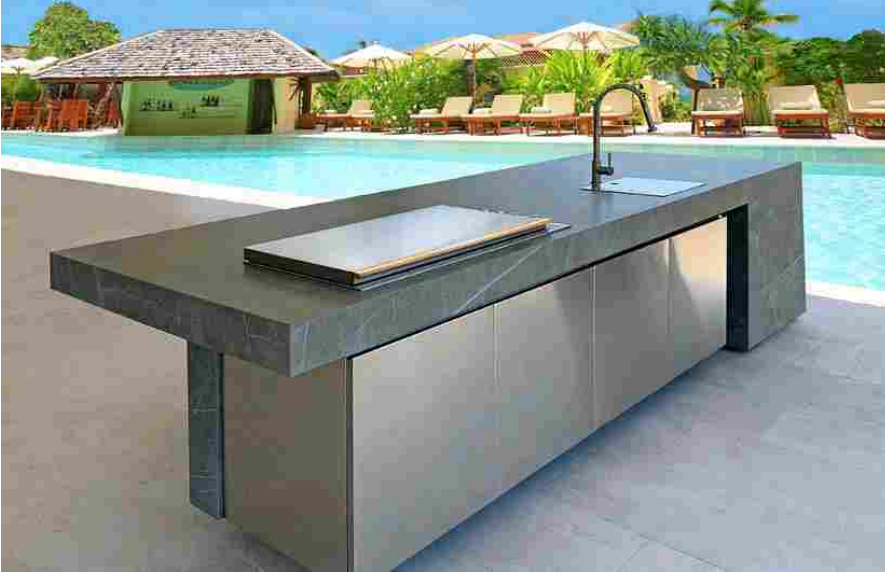
Pininfarina: la nuova cucina per outdoor Essenza