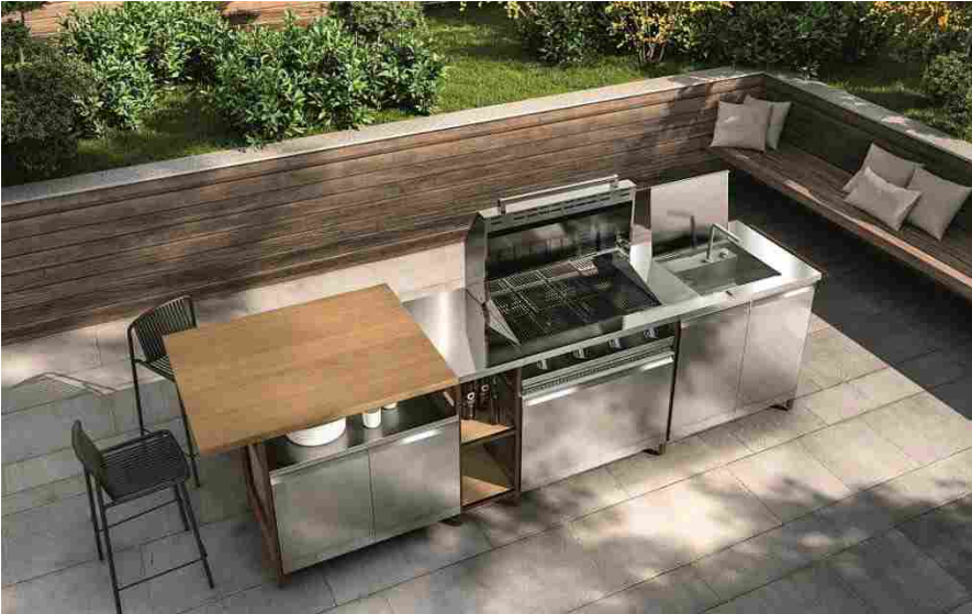
Scavolini: il modello Formalia Outdoor

Il modello Formalia (design Vittore Niu), realizzato da Scavolini , si amplia con la variante Formalia Outdoor , che mantiene i tratti distintivi del modello originale: l'anta sagomata con maniglia e il Sistema Parete Status , sistema modulare a giorno in alluminio finitura Ruggine, Nero e Titanio. La struttura in alluminio e il top con lavello integrato si abbinano a due finiture di ante e di casse: in acciaio o in legno per esterni , ovvero il multistrato di Okumè impiallacciato in teak. Notevole la modularità del modello, che prevede 19 elementi da abbinare a elettrodomestici e ad elementi ribassati o a giorno . Nelle foto, Formalia composta da tre blocchi funzione, con struttura Status in finitura Ruggine e piano snack in teak.