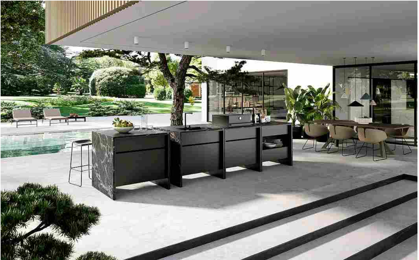
Maistri: la cucina outdoor modulare B-table

Home > Prodotto > Cucine & Design > Il carattere flessibile delle cucine outdoor