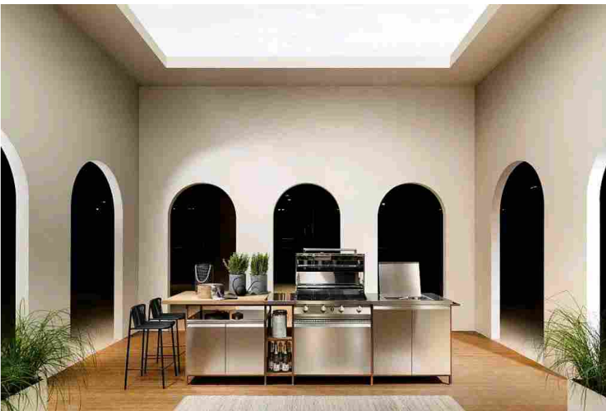
Scavolini: Formalia Outdoor nella soluzione a tre moduli

Il modello Formalia (design Vittore Niu), realizzato da Scavolini , si amplia con la variante Formalia Outdoor , che mantiene i tratti distintivi del modello originale: l'anta sagomata con maniglia e il Sistema Parete Status , sistema modulare a giorno in alluminio finitura Ruggine, Nero e Titanio. La struttura in alluminio e il top con lavello integrato si abbinano a due finiture di ante e di casse: in acciaio o in legno per esterni , ovvero il multistrato di Okumè impiallacciato in teak. Notevole la modularità del modello, che prevede 19 elementi da abbinare a elettrodomestici e ad elementi ribassati o a giorno . Nelle foto, Formalia composta da tre blocchi funzione, con struttura Status in finitura Ruggine e piano snack in teak.