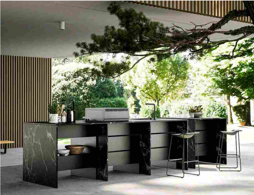
B-table di Maistri è modulare e personalizzabile

Il brand Maistri , del Gruppo Asso, scende in campo per la prima volta con una proposta per l'outdoor. Si chiama B-table ed è realizzata in alluminio verniciato a polvere (RAL 9004) e può essere finita con qualsiasi tipo di pietra naturale o sinterizzata, che possa essere utilizzata per l'esterno. B-table può essere progettata con moduli singoli da un metro oppure in un unico blocco; quest'ultima soluzione prevede un piano di lavoro che collega più moduli cucina che vengono giunti con una fascia della stessa pietra scelta per il top e i lati. È possibile scegliere tra il cassetto e un ripiano accessibile dall'esterno o una formula chiusa "a cestone" con la possibilità di alloggiare all'interno una bombola da 5 kg.