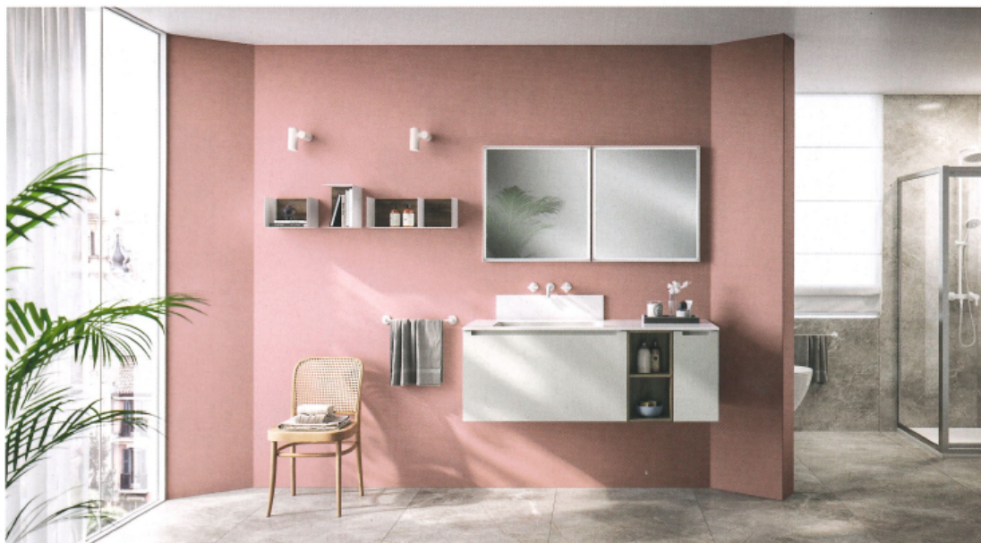
Meubles bas suspendus laqué mat gris Héron, associés à un élément ouvert habillé de mélaminé Noyer Garden. Plan (épaisseur 1,5 cm) en Mineralmarmo avec lavabo Concord intégré. Miroir Lux avec profil blanc mat. Paire de spots D.55 blanc mat. Éléments ouverts en métal blanc avec dossier en mélaminé noyer Garden. Porte-serviettes (Série Rim) finition blanc mat. Sur la droite, cabine de douche Visual avec portes en accordéon extérieur.

À en croire le fabricant, « polyvalence, précision de conception et recherche esthétique sont les mots d'ordre de cette collection, qui offre un design haut de gamme et d'excellentes solutions pour les lignes de sanitaires, la robinetterie, les baignoires, les receveurs et les cabines de douche (destinées à s'intégrer dans le projet de manière équilibrée et harmonieuse). »