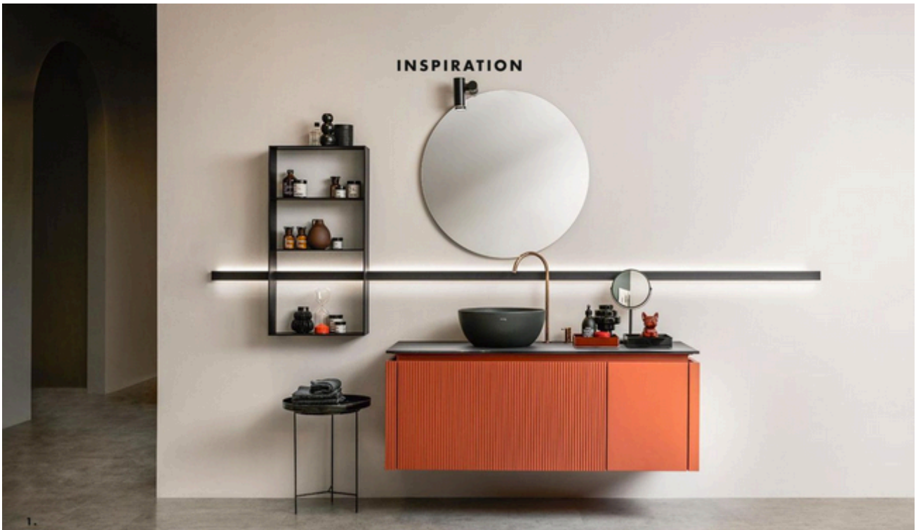
JUSTE ÉQUILIBRE 1. « Libra », design Vuesse, meubles bas, finition laquée mate « Rouge Maroc », une composition intégrant 2 modules, plan en verre « Noir Ardoise », lavabo à poser en céramique noire, multiples configurations et plusieurs finitions possibles, prix sur demande, Scavolini Store Paris. Au mur, meuble de rangement et barre porte-accessoires, en aluminium noir, prix sur demande, l'ensemble Scavolini Store Paris. 2. « Flow », design Paolo Ulian, lavabo autoportant, en marbre blanc de Carrare, la colonne cylindrique peut intégrer une source lumineuse pour générer un halo et créer un effet de suspension autour du bassin, également disponible en d'autres finitions, prix sur demande, Antoniolupi. 3. « Bloque », design Patricia Urquiola, meuble de rangement, en pierre Lava Stone, peut intégrer tous les lavabos proposés par le fabricant italien, multiples compositions, existe aussi en bois, 3 finitions, prix sur demande, Agape. Adresses page 164